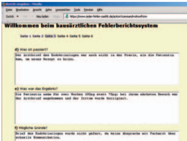
Abb. 3: Hier fragt das System den konkreten Ablauf der Ereignisse und mögliche Ursachen ab

gefragt (siehe Abbildungen 1–4). Die Eingabe dauert nur etwa fünf Minuten. Um die Anonymität zu wahren, wird darauf hingewiesen, keine personenbezogenen Daten zu berichten.