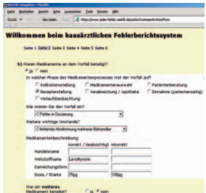
Abb. 2: Auf der zweiten Seite beschreibt der Arzt unter anderem, in welcher Phase der Behandlung und mit welchen Medikamenten sich der Vorfall ereignete